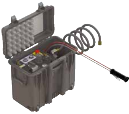
Luftaufbereitungsmodul und Fernsteuerung in einem robusten, leichten, tragbaren Komplettpaket.