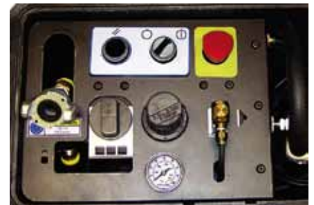
Ergonomische manuelle Steuerung für alle Druckluft-Funktionen mit Sicherheits-Stopptaste.