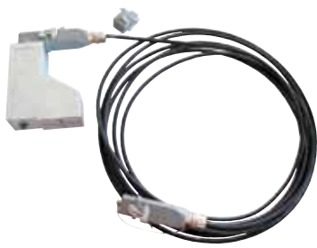
Vorschubeinheit einschließlich Kabel