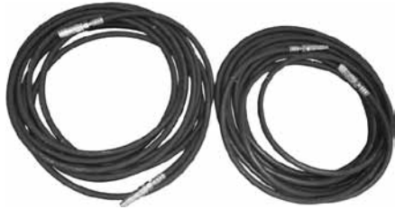
Hydraulikschlauchsatz (15 m)