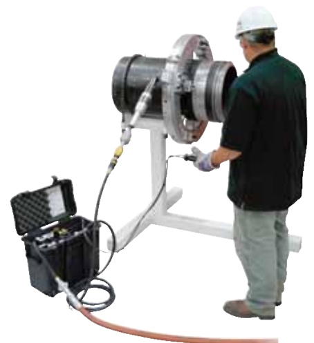
ACM zur Steuerung einer Low Clearance Split Frame