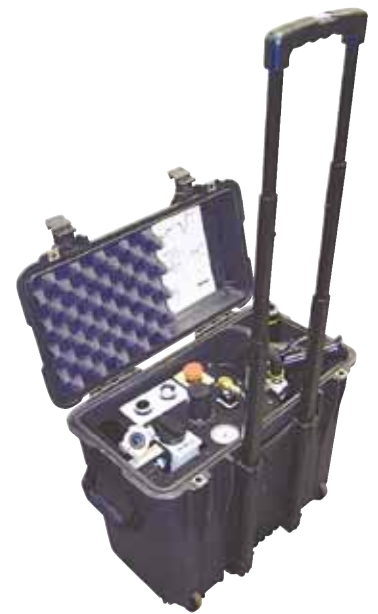
Steuerungsmodul ACM für Druckluftmotoren

All-in-One. Beim ACM handelt es sich um zwei Produkte in einem – ein Luftaufbereitungsmodul, das die Druckluftversorgung reguliert und aufbereitet, um die wertvollen Druckluftmotoren zu schützen, und eine Fernsteuerung, mit der sich der Bediener bei Bedarf von der Maschine entfernen kann. Diese All-in-One-Funktion macht das ACM von WACHS zu einer sehr kostengünstigen Investition, die sich in puncto Langlebigkeit des Antriebsmotors, Komfort des Bedieners und Vielseitigkeit der Einsatzmöglichkeiten schnell auszahlt.