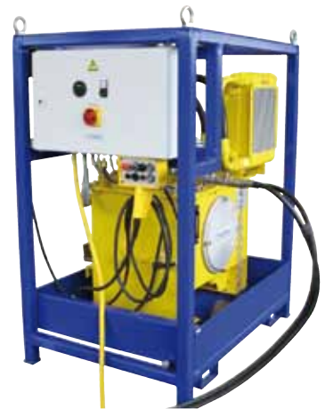
Hydraulikaggregat – Rückansicht