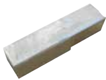
Inserito utensile HSS standard 9,5 x 9,5 mm