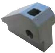
Portaplasticche per lavorazione interna a punto singolo