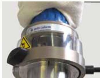
Exaktes Resultat durch Vorschub mit Millimeter-/ Inch-Skalaenteilung