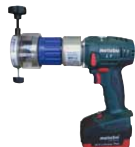
RPG 1.5 Akku