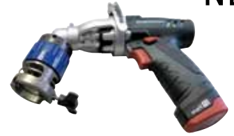
RPG XS Winkel-Akku