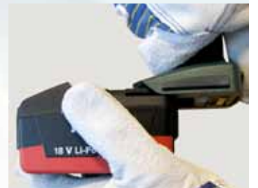
Akkumulatoren mit leistungs- starker und umweltfreundli- cher Lithium-Ionen- Technologie!