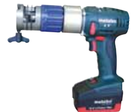
RPG ONE Akku