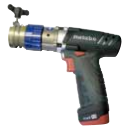
RPG XS Akku

Auf Anfrage Standplatte für Akku-Maschinen optional erhältlich (Code 790 037 169).