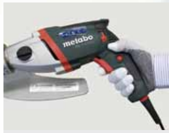
Drehzahl geregelter Elektromotor