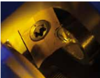
Gratfrei und rechtwinklig