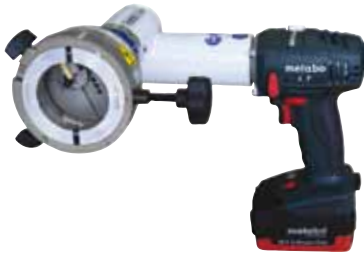
RPG 2.5 Akku