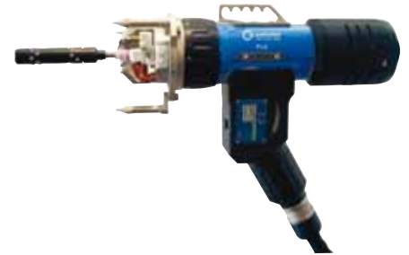
Têtes de soudage pour tubes sur plaque P16 AVC

Identique à la tête de soudage P16, équipé de plus avec d'un réglage électronique de tension dl'arc (AVC). Uniquement utilisable en combinaison avec le générateur de soudage ORBIMAT 300 CA AVC/OSC (voir page 10). Dévidoir de fil froid compris.