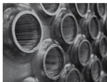
Torche pivotant sans paliers jusqu'à 30° (plage de diamètres réduite)