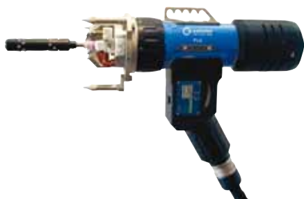
Têtes de soudage pour tubes sur plaque P16

La longueur du faisceau est de 7,5 m (24,6 pieds). Rallonges de faisceaux voir page 29.