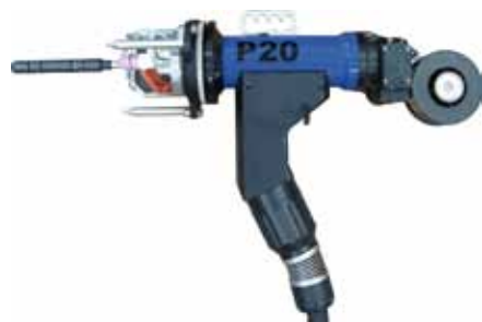
Tête de soudage pour tubes sur plaque P20 avec fil froid

La longueur du faisceau est de 7,5 m (24,6 pieds). Rallonges de faisceaux voir page 29