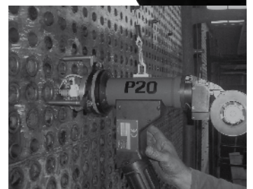
Le positionnement s'effectue dans le tube à souder à l'aide d'un mandrin de centrage enfiché sur une broche de fixation.