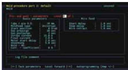
Guidage par menu en plusieurs langues sur moniteur couleur