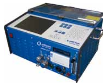
ORBIMAT 165 CB