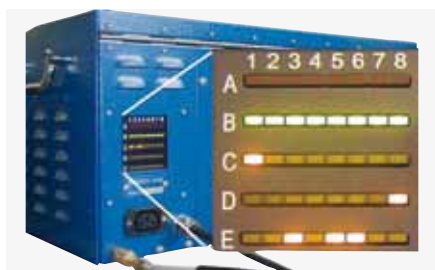
Système PSS (Pro-Service-System) : vérification simple de fonctions sans ouverture de l'installation