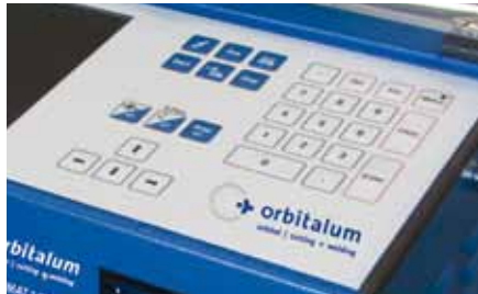
Clavier numérique très fonctionnel et de grande qualité