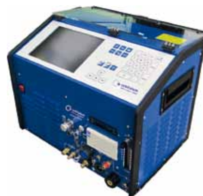
ORBIMAT 300 CB