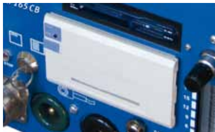
Imprimante fonctionnelle intégrée