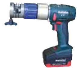
RPG ONE 电池式