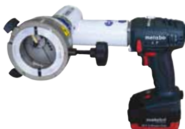
RPG 2.5 电池式