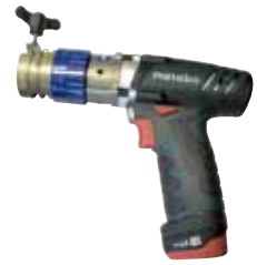
RPG XS 电池式