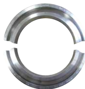
Ganasce di serraggio in alluminio o acciaio per RPG 8.6