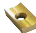
Placchetta multifunzionale MFW