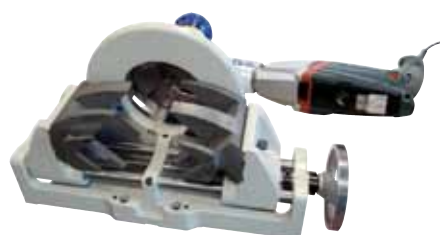
RPG 4.5 S