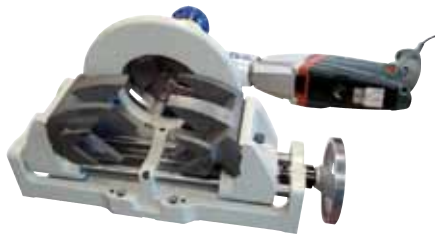
RPG 4.5 S