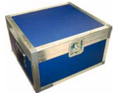
Valigetta di trasporto rigida