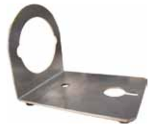
墙壁/桌子/钳子固定片