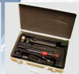
配有实用的、粉末涂层的 包装箱