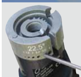
打磨电极: - 4 种不同的角度 - 6 种不同的电极直径