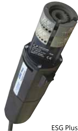
ESG Plus 2