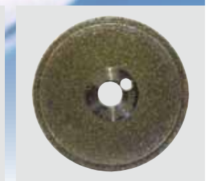
包含双面的、可调换的金刚石磨片，使用时间更长